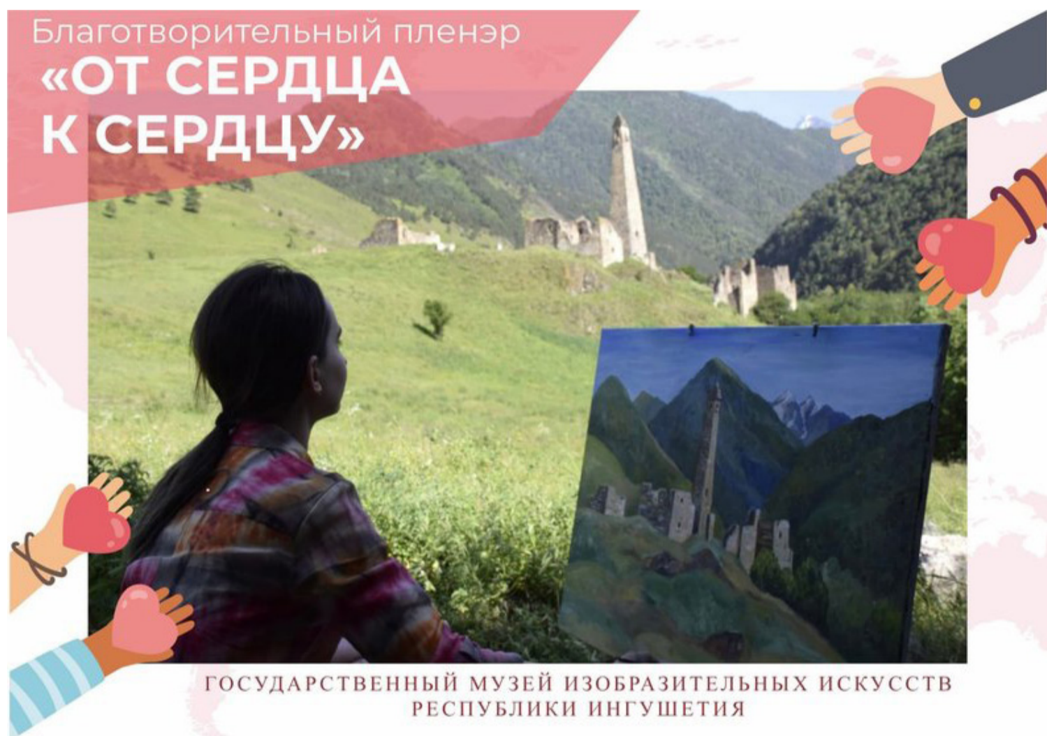
ГОСУДАРСТВЕННЫЙ МУЗЕЙ ИЗОБРАЗИТЕЛЬНЫХ ИСКУССТВ РЕСПУБЛИКИ ИНГУШЕТИЯ